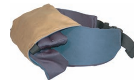
sistemato come marsupio